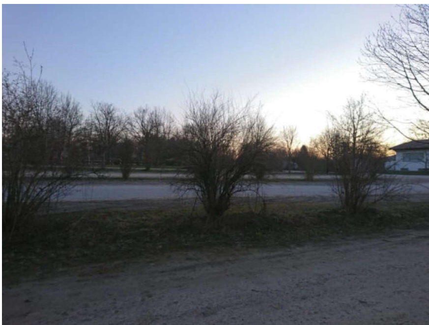
Abb. 02 Parkplatz im nördlichen Teil des Untersuchungsgebiets.