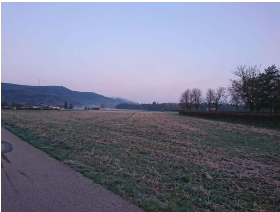
Abb. 03 Blick auf das Feld im Nordöstlichen Bereich des Untersuchungsgebiets.