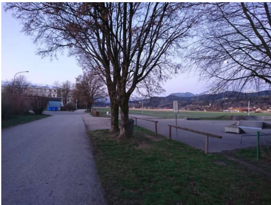
Abb. 01 Blick von Nord nach Süd. Hecken- und Baumstrukturen an der Westgrenze des UG, sowie intensivgenutztes Grünland und einen Skatepark.